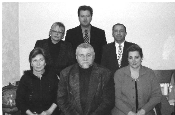
Этот номер сделали мы