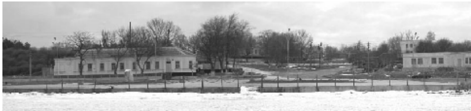
Фото. Морские ворота Тамани

Аборигенами Тамани при греческой колонизации были синды, в которых исследователи единодушно видят ближайших потомков Ариев. Память о них и античной культуре Таманского полуострова в целом сохранилась в русских былинах, как сказочное индийское царство, куда герои стремятся за счастьем и богатством. (А.В. Ткачев. Боги и демоны «Слово о полку Игореве»